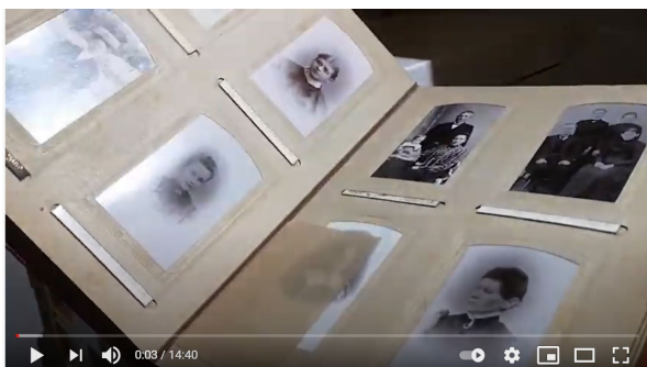
Ydre Lokalhistoriska Arkiv - Arkivröster i Östergötland