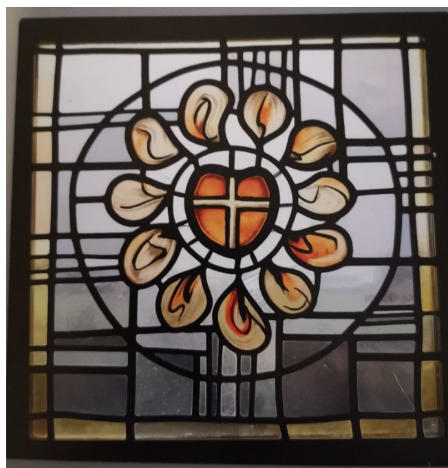
Glasfönster från Heliga Hjärtas kloster, Borghamn.

Vi skickar ut inbjudan till alla cirkelledare kontinuerligt.