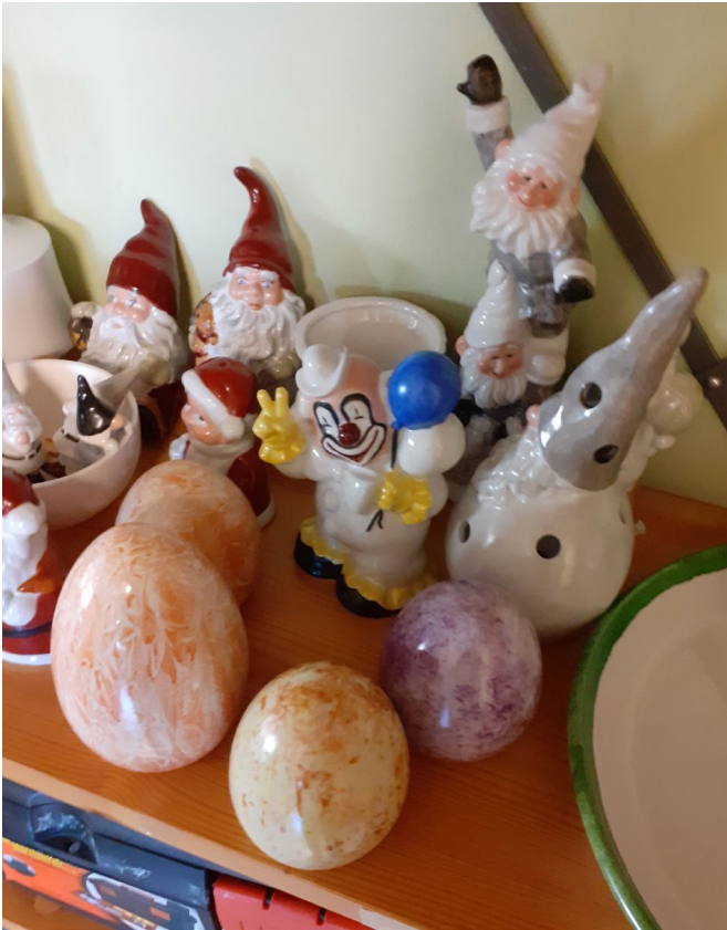
Porslin: Flera porslinsmålningsskivlar hängde i under både våren och hösten.

Vadstenas lokaler fick en ny ugn för porslinsmålning och köpte även in ett lite större parti porslin. Under våren pågick fyra porslinsmålningsskivlar och under hösten försökte tre skivlar hålla igång sin verksamhet.